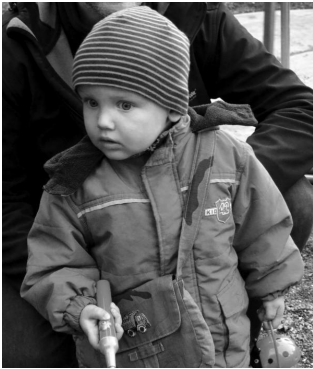
Na, geht es nun bald los?