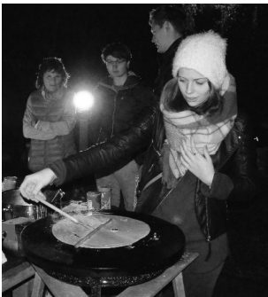
Bis spät in den Abend reicht der Crêpes Teig