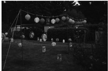
Auch die Anwohner haben einen kräftigen Beitrag zum Gelingen des Festes geleistet